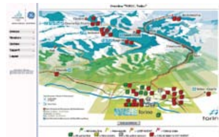
Przykład reprezentacji graficznej